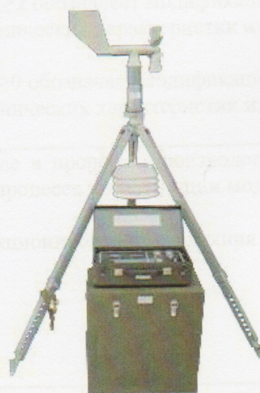
Рисунок 2 Полевой вариант М-49М

Пломбирование станций метеорологических М-49М не предусмотрено.